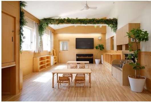
【電子黒板が設置された5歳児保育室】