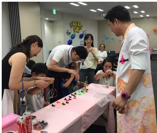
【サイエンスクリエイター&パフォーマー善ちゃんによる「科学実験教室」】

JPホールディングスでは今後も、従業員が働きやすい職場環境づくりに努めてまいります。