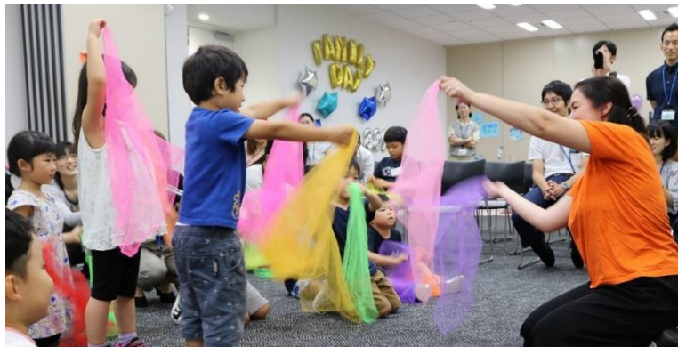
【株式会社ジェイキャストによる「英語&リトミック教室」】

※「conoco terrace™ (コノコテラス)」は脳科学に基づいて診断した子どもの個性に合った最適な絵本を選書し、その絵本を遊び尽くすガイドブックとセットで家庭に届ける凸版印刷株式会社が提供するサービスです。