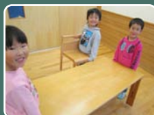
テーブルセッティングもばっちり！