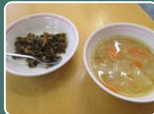
ダイコンの葉ふりかけと オリジナル豚汁の完成！