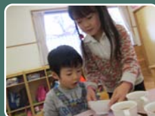
「どうぞ召し上がれ☆」