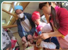
採りたてダイコンで 豚汁クッキング☆