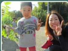
親子で育てたダイコンの収穫！

「このような取り組みから子どもたちが食べる楽しみを感じてくれたらうれしいです」「豚汁とてもおいしかったです」という声をいただきました！